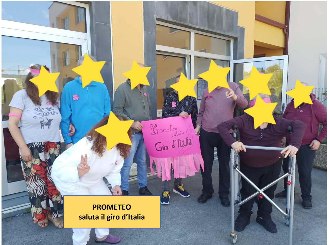
PROMETEO saluta il giro d'Italia